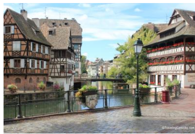
La Petite France