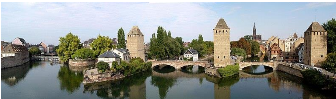
Les Ponts Couverts