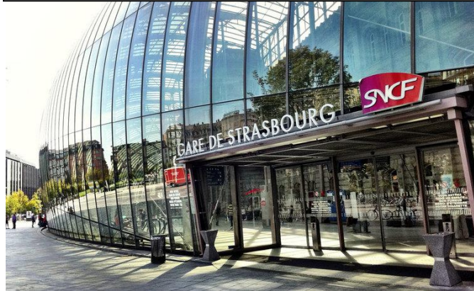
Gare de Strasbourg