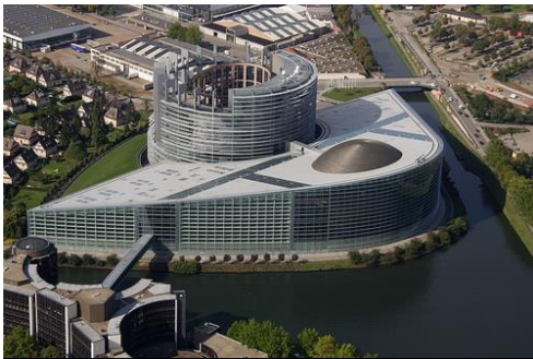
Le Parlement Européen