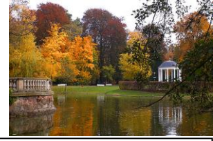
Parc de l'Orangerie