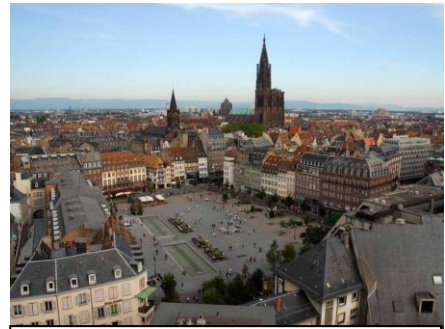
La place Kléber