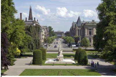
La place de la République